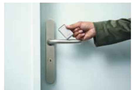
Einfache Programmierung der Transponder über den Türdrücker.