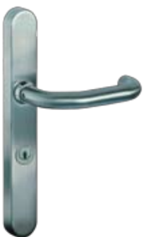
Kaba TouchGo™ Türbeschlag

Das oberste Ziel jedes Schließsystems ist Sicherheit. Diese ist bei Kaba TouchGo™ in höchstem Maß gegeben, denn ein verloren gegangenes Zutrittsmedium wird rasch und einfach gesperrt. So werden gleichzeitig Sicherheitslücken und auch das kostenintensive Ersetzen ganzer Schließanlagen vermieden. Neben dem neuen Komfort ist dies ein weiterer wesentlicher Vorteil des elektronischen Zutrittssystems.