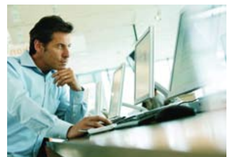
Maximaler Investitionsschutz dank einfach programmierbarer Berechtigungsmedien.

Auch hier bleiben keine Wünsche offen, denn der Kaba c-lever mit Kaba TouchGo™ Funktion wird nahtlos in die bestehenden Kaba Sicherheitskonzepte eingebunden. Ihr System bleibt so sicher, wie es bereits war: Kaba TouchGo™ ist eine Komfortoption, die keinen Einfluss auf Ihr Sicherheitsdispositiv hat und höchsten Investitionsschutz garantiert.