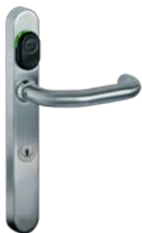
Kaba c-lever mit TouchGo™-Funktion

Der Kaba c-lever mit Kaba TouchGo™ Funktion verfügt über ein optionales Elektronikmodul, welches die Kaba TouchGo™ Eigenschaften in den Beschlag integriert. Um die Vorteile des schlüssellosen Eintritts nutzen zu können, braucht es nur noch einen aktiven Kaba TouchGo™ Kartenhalter. Somit behalten Sie Ihre RFID-Funktionen und profitieren gleichzeitig vom Kaba TouchGo™ Bedienkomfort.